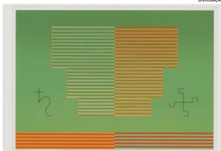
Em cima: Permuta LIX = 1/1 - Jano Bifronte, Senhor do Tríplice Tempo: passado, presente, Futuro. 1980, serigrafia

Esta experiência só ocorre quando o serígrafo é o autor de sua obra, ou seja, quando obra e artista iniciaram e concluíram o processo juntos. Assim como usar a matriz espontânea, de curta durabilidade, ofereceu novas possibilidades criativas, exigindo cuidado com a carga de tinta e a pressão sobre a tela com os puxadores de borracha sintética, a mistura de materiais como grafite, linhas e papel picado à impressão, conferiram um caráter artístico e experimental a serigrafia, além de novas possibilidades ao trabalho criativo.