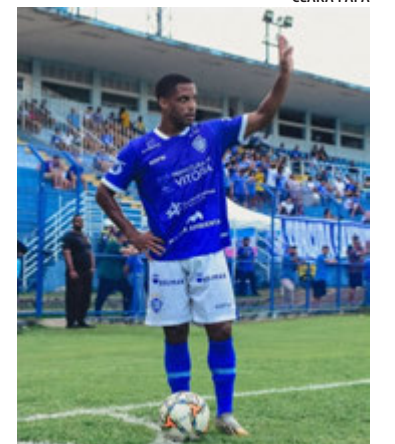
Vitória enfrenta o Linhares no dia 7 de maio pela Copa ES