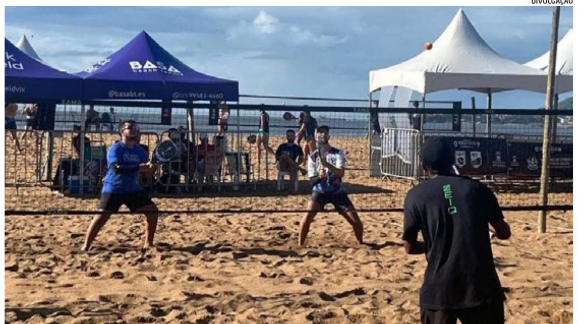
Campeonato será na Praia da Costa e segue até o domingo (4), valendo pontos para ranking do ES

As disputas serão realizadas nas categorias masculino, feminino e mista (A, B, C e D, Sub-14, Sub-18, 40+, 50+ e 60+). As inscrições para participar da competição seguem abertas até as 20 horas desta terça-feira (29).