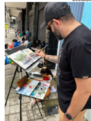
Cidade de Vitória é um prato cheio para os urban sketchers