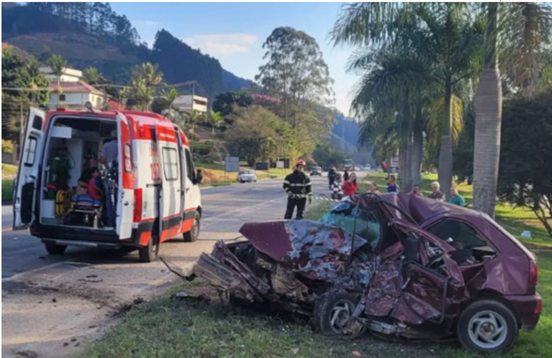
Um grave acidente entre três veículos na altura do km 114 da BR-262, em Venda Nova do Imigrante, região Serrana do Espírito Santo, deixou uma pessoa morta; um dos carros invadiu a contramão