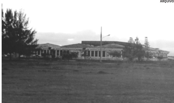
Imagem do Cemuni, na Ufes, no final da década de 1970

No meio da sala, uma mesa grande com pratos e talheres, tendo ao centro uma enorme moranga com bobó de camarão enfeitada com lagostas. A comida, com cara de capa de revista de culinária, vinha com fatura de detalhes e cores e era sa-