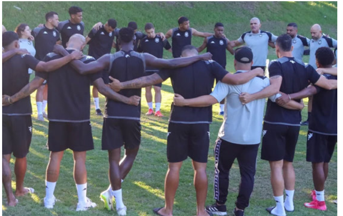
WAGNER CHALÓ/RIO BRANCO

A promoção faz parte de uma ação de uma patrocinadora do Rio Branco, que vai disponibilizar 5 mil ingressos pelo valor promocional. Até agora, quase 2 mil ingressos foram vendidos.