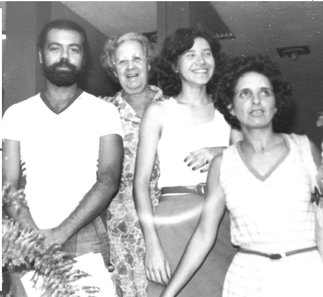
Nos anos 70, os encontros no Cemuni, conjunto de prédios dos cursos de artes da Ufes, eram dotados de sinergia imagética e sensorial

cumprir suas atividades técnicas. Era mais que um artífice de sua própria produção. Nada nele era enigmático, pois seu métier era prático, divertido, interessante — fosse numa conversa, fosse no suporte técnico de rotina.